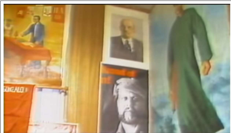
Fotografías de Bob Avakian, Lenin y Mao en la oficina de Gonzalo. Foto tomada del video del allanamiento al anterior lugar de vivienda y trabajo de Gonzalo.

Los revolucionarios e intelectuales progresistas del mundo sintieron profundamente la gravedad del arresto de Gonzalo. Y ardieron de furia especialmente cuando, para mostrar su poder, el régimen peruano lo